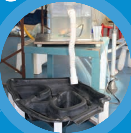
Illustration: HAMBURG WASSER

Im Klärwerk werden die Müllreste mit einer Art ‚Harke‘ heraus gefischt. Den Dreck – auch Urin und Kot – ‚fressen‘ winzige Bakterien aus dem Wasser. Diese brauchen Sauerstoff zum Atmen, damit sie arbeiten können.